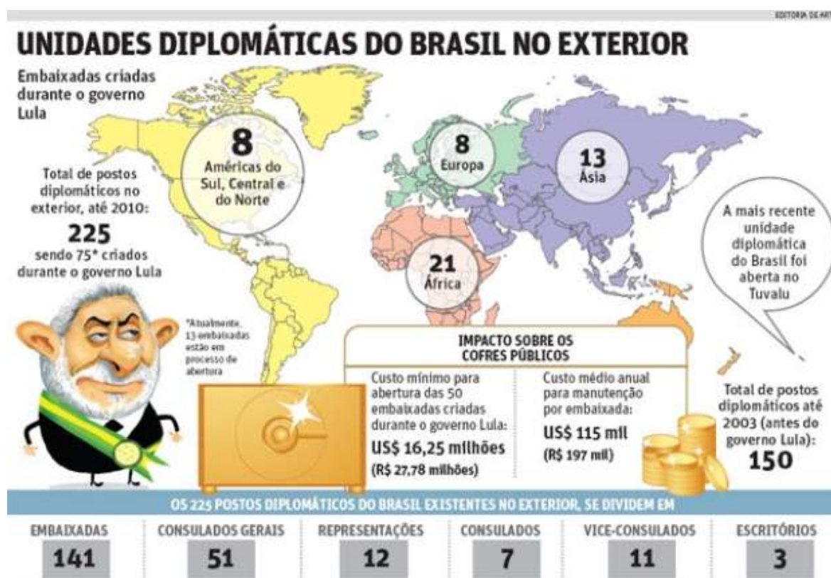
Figura 1: Unidades Diplomáticas do Brasil no Exterior

As pretensões brasileiras de um assento permanente tem como estratégia o capital político-diplomático acumulado (Figura 1), respaldado na noção de resolução pacífica dos conflitos que lhe credenciaria um papel mais destacado, de interlocutor em crises internacionais. Entretanto, as ações do governo brasileiro desde o governo Lula não se restringem a essa linha de atuação, uma vez que a presença em missões de paz da ONU faz parte dessa estratégia. A implantação de novas embaixadas também faz parte desse caminho (Figura 1).