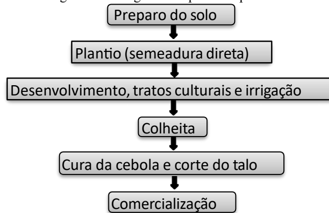
Figura 1: Fluxograma do processo produtivo