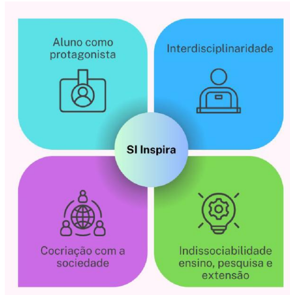
Figura 2. Pilares originais do Projeto SI Inspira

abordagem prática , é composta por 18 capítulos e apresenta a descrição dos trabalhos desenvolvidos por alunos e membros da comunidade externa em ações de extensão. Essas ações envolveram a definição da cadeia de valor, a modelagem de processos e a elaboração de POPs (Procedimentos Operacionais Padrão) em diferentes instituições (Nobre et al. , 2025). A publicação evidencia que o projeto tem conseguido realizar entregas alinhadas aos seus pilares originais (Figura 2).