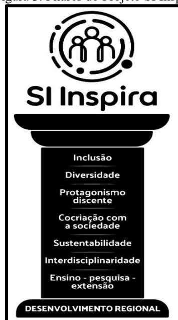
Figura 3. Pilares do Projeto SI Inspira

Durante o período de divulgação do projeto, em meados de 2025, a equipe gestora do SI Inspira identificou a necessidade de incorporar três novos pilares, em resposta a demandas contemporâneas e às sugestões de alunos e da comunidade externa. Dessa forma, foram acrescentados ao projeto os pilares da inclusão, da diversidade e da sustentabilidade, resultando na configuração atualizada apresentada na Figura 3.