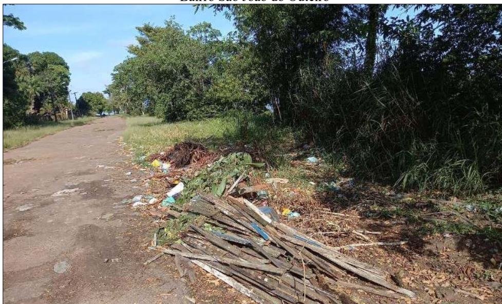
Figura 2: Lançamento de entulho de lixo diretamente na falésia provocando o acúmulo de água, fragilizando o solo – Bairro São João do Outeiro

Dessa forma, a apropriação do espaço através de diversas intervenções que o homem realiza no ambiente urbano, tais como: desmatamentos, cortes de talude, aterros, concentrações de águas superficiais, vibrações etc., caracteriza-se como o fator que atua de forma mais extensa e intensa na instabilização de terrenos de topografia inclinada nas cidades. É possível verificar uma das intervenções na figura 2 a seguir: