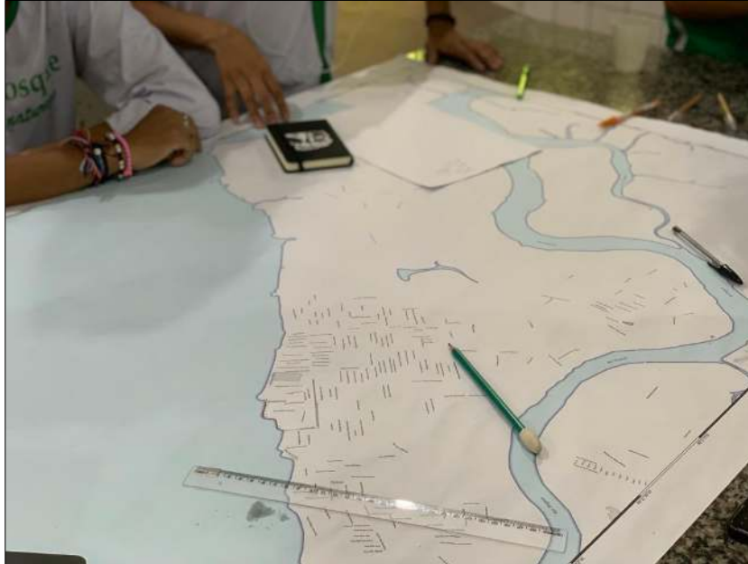
Figura 9: Identificação do trecho que será visitado na aula de campo para averiguação das áreas de deslizamento

As metodologias e práticas de mapeamento coletivo realizadas pelas comunidades são significativas e conjuntas.