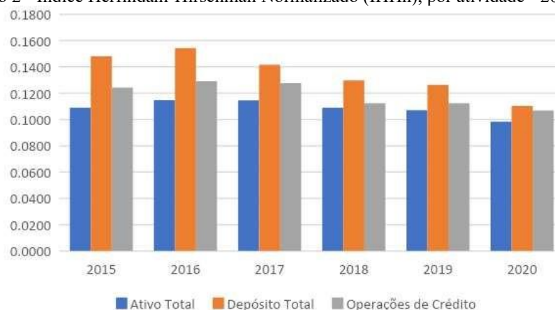
Gráfico 2 - Índice Herfindahl-Hirschman Normalizado (IHHn), por atividade - 2015-2020

Fonte: Elaboração própria a partir de Bacen (2021).