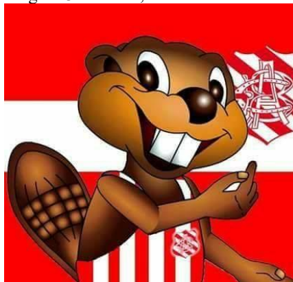
Figura 3 – Castor, o mascote do clube