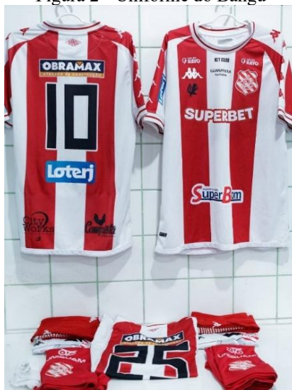
Figura 2 - Uniforme do Bangu