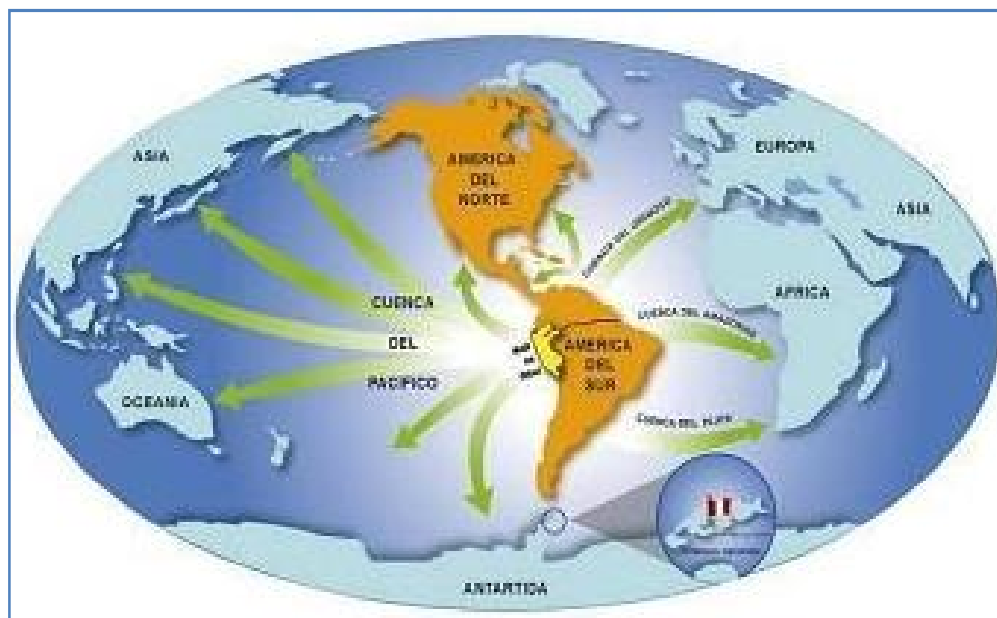
Figura 1: Corredores marítimos estratégicos da República do Peru