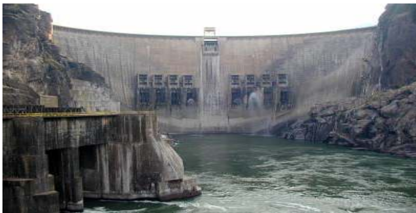
Foto 1: Barragem de Cahora Bassa, uma externalidade a produção de energia

concretização e materialização de grandes empreendimentos energéticos e agroindustriais, como são os casos da Barragem de Cahora Bassa, do Projeto do Carvão de Moatize, das açucareiras de Marromeu e do Luabo. Além disto, há culturas da copra, do algodão e tabaco que, no entanto, ainda não foram traduzidas em fatores de desenvolvimento.