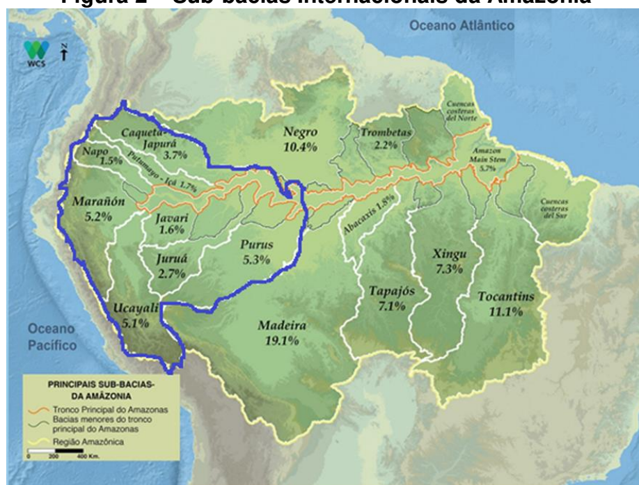
Figura 2 – Sub-bacias Internacionais da Amazônia

Além de se pensar a região como uma área de manobra geopolítica é necessário compreender o contexto internacional em que a mesma está inserida. Em termos de bacia de drenagem a questão internacional deve ser pensada, pois a Figura 2 ressalta o contexto continental.