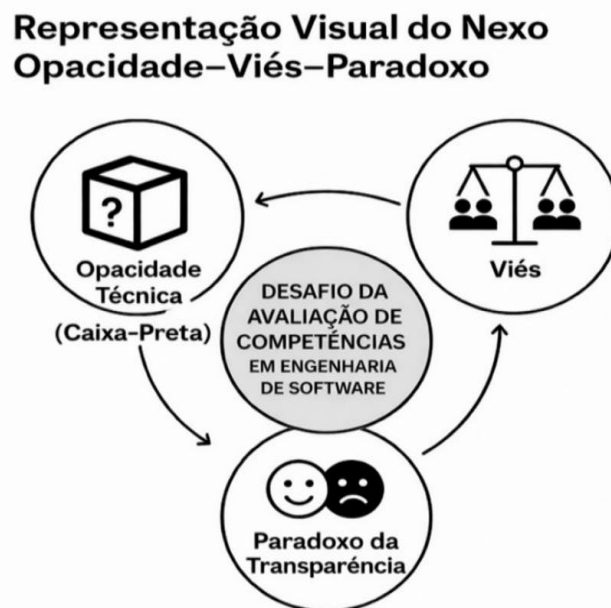
Figura 3. Representação visual do Nexo Opacidade–Viés–Paradoxo

A Opacidade Técnica impede que o aluno perceba a origem estatística das respostas, facilitando a aceitação acrítica do Viés Algorítmico. Essa interação resulta no Paradoxo da Transparência: momentos avaliativos onde o discente apresenta um código funcional, mas falha ao explicá-lo.