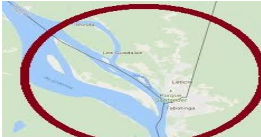
Figura 3 : Pivô Geográfico

constituído um elemento discursivo importante entre os limites colombiano e brasileiro, e repercutindo uma nova ação peruana.