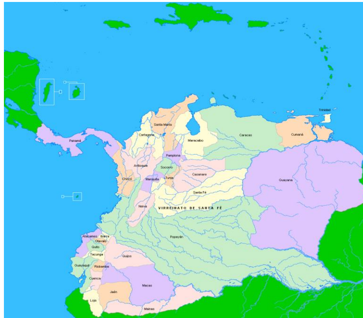
Figura 1: A Grande Colômbia