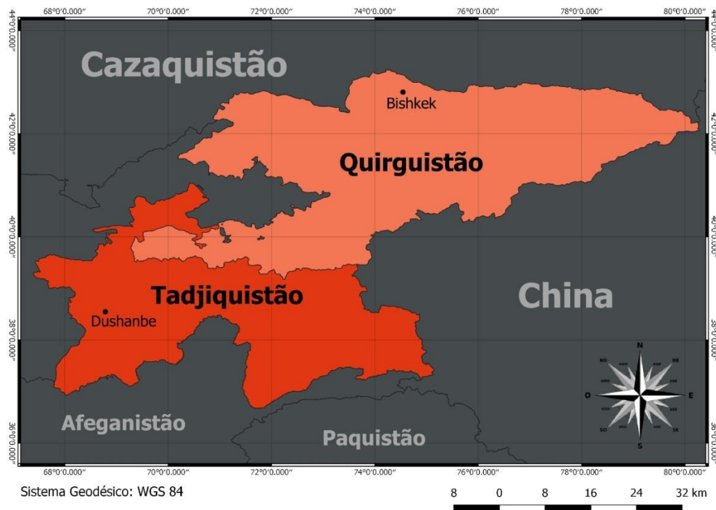
FIGURA 1 – Fronteira entre Quirguistão e Tadjiquistão

Aqui cabe um Intermezzo : não temos páginas o suficiente para discorrer extensamente sobre isso, porém, cabe ressaltar que a composição da projeção cartográfica exposta no parágrafo anterior provocou, se considerarmos a noção de lugar proposta por Agnew (1987) como uma mescla da localização, do local e de senso de lugar, uma profunda ruptura identitária que com o avanço das gerações apresentaram uma propensão ao degradamento das conexões ali estabelecidas. Veremos mais adiante que essa fenda oprimente também gerou certa influência sobre as teicopolíticas que se revelaram na Ásia Central.