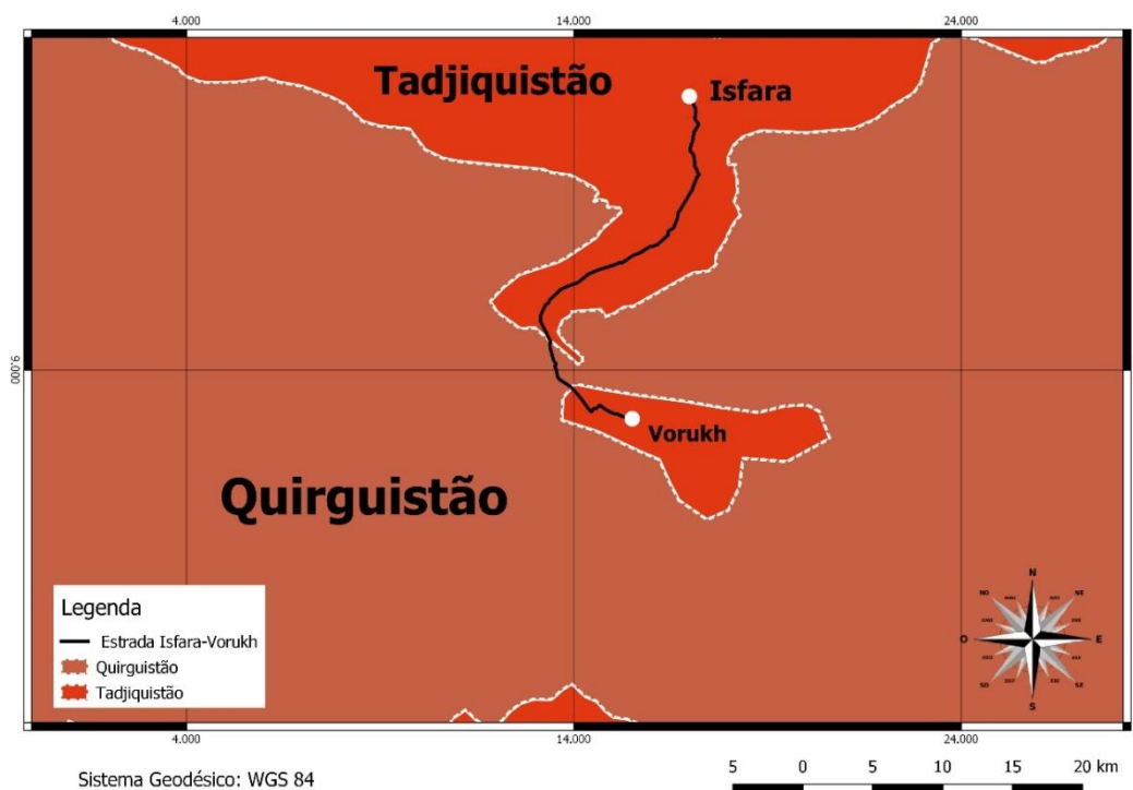
FIGURA 2 – Localização do enclave tadjique Vorukh, em território quirguiz, e a rodovia que o liga até o Tadjiquistão

Voruk, que liga o enclave tadjique, localizado em território quirguiz, até a fronteira do Tadjiquistão (ver figura 2). Para o mesmo incidente, é existente a versão em que os quirguízes teriam feito a tentativa de instalação de uma placa, com o nome do vilarejo vizinho e quirguiz, Ak-Sai, em Voruhk, portanto, em território tadjique.