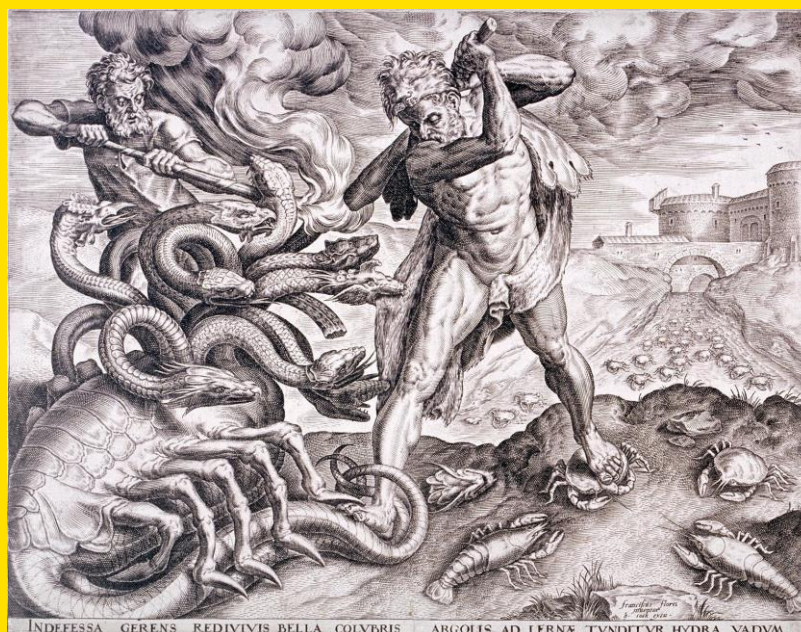
Hércules Matando a Hidra de Lerna, Cornelis Cort (1533–1578). A figura mitológica de um monstro com vários tentáculos ou cabeças que faz parte de um só organismo no imaginário popular é ancestral e remete, na sua forma atualizada, ao que chamam de “globalismo”.

centros de força, não raro se engalfinham em suas “guerras por procuração”, as chamadas Proxy Wars , que se tornaram, particularmente frequentes da Guerra Fria até os dias de hoje.