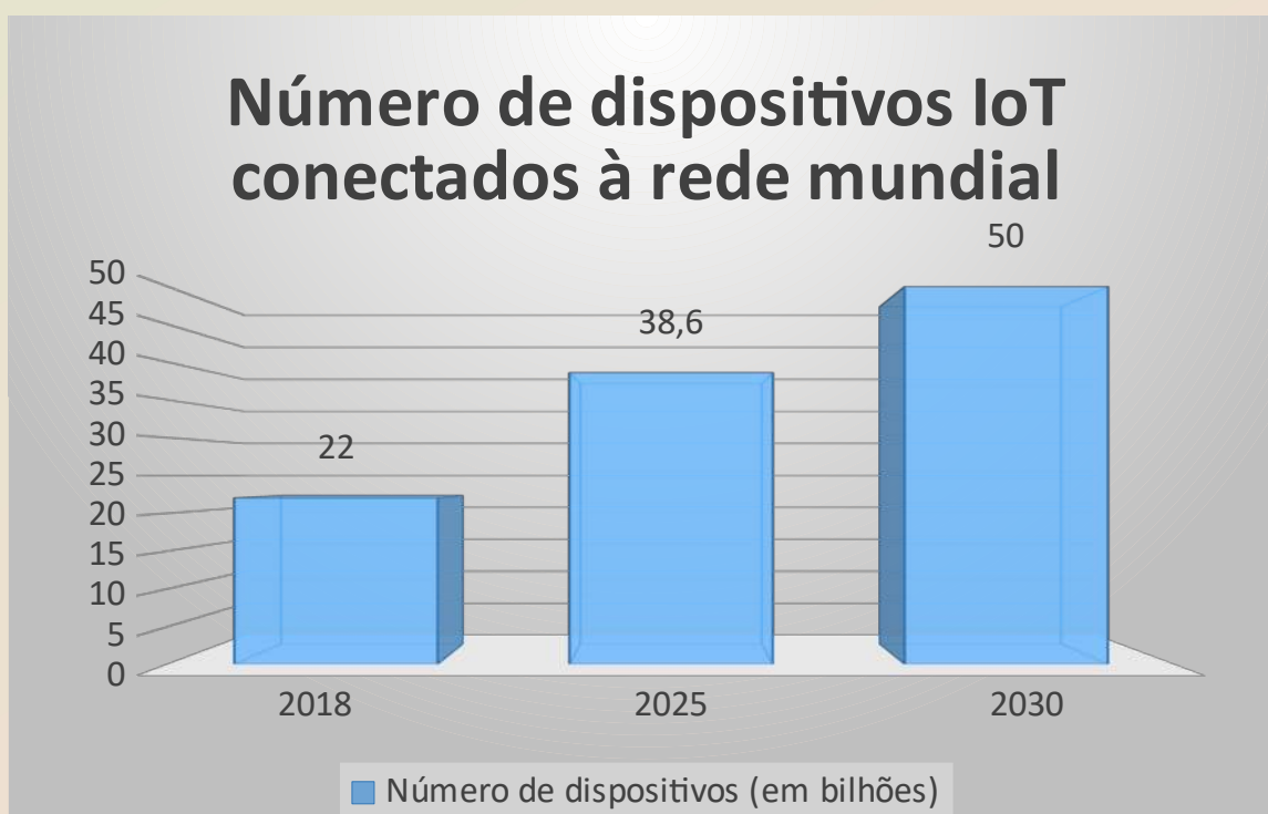
Gráfico 1 – Número (em bilhões) de dispositivos IoT conectados à rede mundial