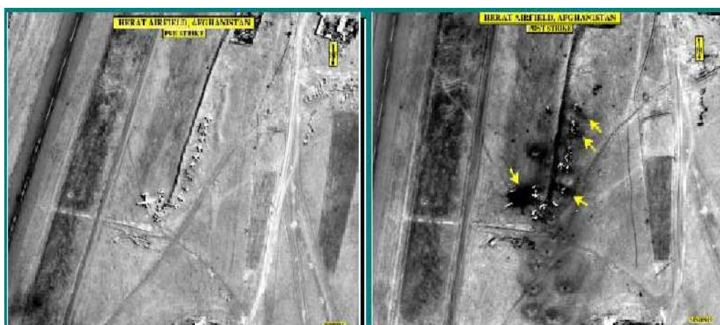
Figura 3 – Antes e Depois de bombardeio no Afeganistão, 2002.

O recurso de reconhecimento de territórios a partir de fotografias aéreas também foi utilizado no Afeganistão, em 2002. Na Figura 3 observa-se a área antes e após o bombardeio norte-americano, no local escolhido após o reconhecimento. Esta tecnologia que têm como produto as fotografias aéreas tornou preciso os ataques por bombas, sendo privilegiado o Estado que a tem disponível.