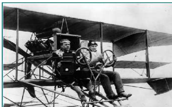
Figura 1 – Piloto e fotógrafo aéreo com uma câmera de reconhecimento Graflex 1915.

Na Primeira Guerra Mundial a técnica de fotografias aéreas já foi utilizada para o reconhecimento de territórios, o que permitiu uma maior precisão nos ataques (Figura 1).