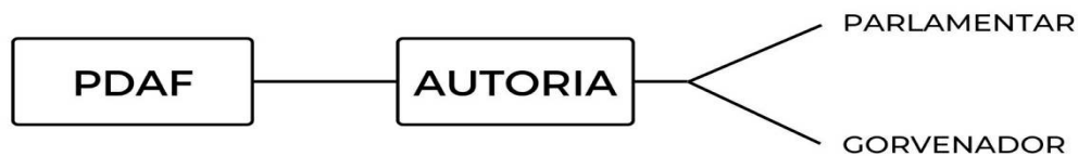
Figura 1: PDAF e sua autoria conjunta.

parlamentares iniciaram propostas de Descentralização Orçamentária na tentativa de ver uma possível apropriação de sua ideia pelo Poder Executivo.