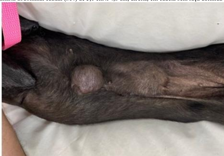
Figura 2 – Tumor mamário entre glândulas torácica caudal (M2) e abdominal cranial (M3) de 4,5 cm x 4,0 cm e em glândula mamária abdominal caudal (M4) de 5,0 cm x 4,8 cm, direita, em cadela sem raça definida com 12 anos.

No exame de ultrassonografia abdominal foi identificado grande estrutura heterogênea, predominantemente hipoecogênica, de contornos irregulares, medindo cerca de 4,18 cm x 8,72 cm (Figura 3) ocupando grande área de região meso e hipogástrica, não sendo possível identificar a sua origem, presença de discreto líquido livre em toda cavidade abdominal. As demais estruturas abdominais se encontraram dentro da normalidade.