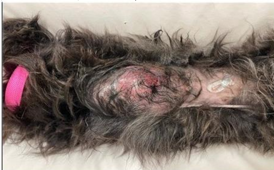
Figura 1 – Tumor mamário em mama torácica caudal, abdominal cranial e abdominal caudal da cadeia mamária esquerda, de 12 cm x 6 cm x 5 cm, em cadela sem raça definida com 12 anos de idade com área de ulceração.

Frente ao caso clínico, o veterinário responsável solicitou hemograma e exames bioquímicos, ultrassonografia abdominal e radiografia de tórax para detecção de metástase e planejamento cirúrgico com posterior envio da peça cirúrgica para histopatológico. A tutora autorizou apenas a realização dos exames hematológicos, devido a questões financeiras (Anexo I). Não foram encontradas alterações no hemograma e em relação aos exames bioquímicos, aumento de enzimas hepáticas AST 67 U/L (valor de ref. 16-40 U/L) e FA 2131 U/L (valor de ref. 20-156 U/L). Foi reforçado a importância de exame de ultrassonografia abdominal, mas sem sucesso.