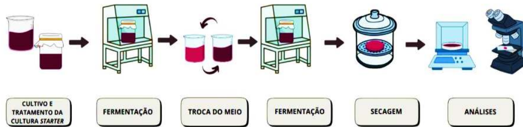
Figura 1 – Fluxograma apresentando as etapas da produção do biofilme / Scoby a partir da E. oleracea .